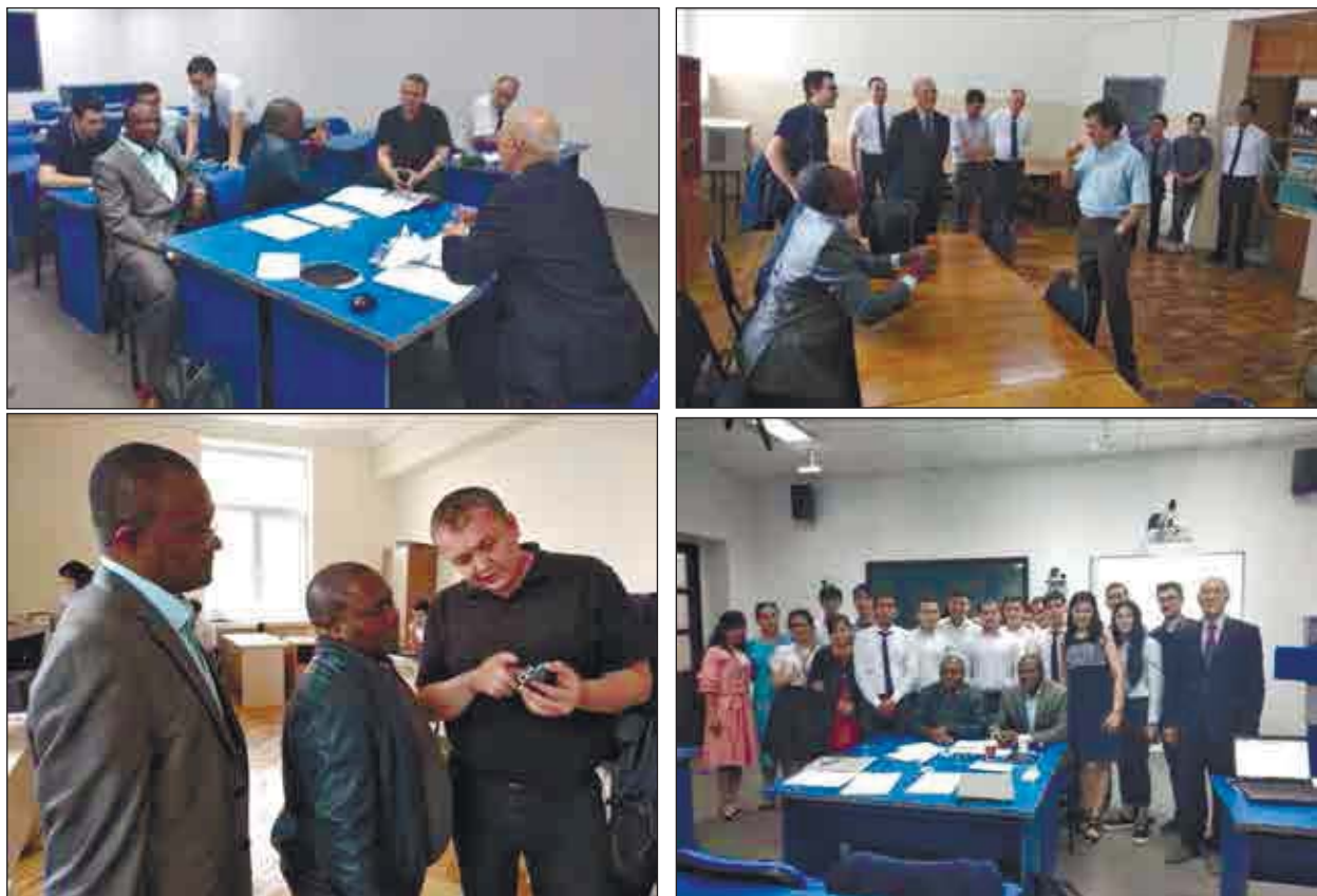
2-расм. Университетларнинг ўқув дастурларини ўрганиш семинари

Университетнинг элит гуруҳи билан учрашув ташкил этилди. Лабораториялар билан таништириш мақсадида ушбу лабораторияларнинг маъсуллари қисқача маълумотлар беришди (2-расм).