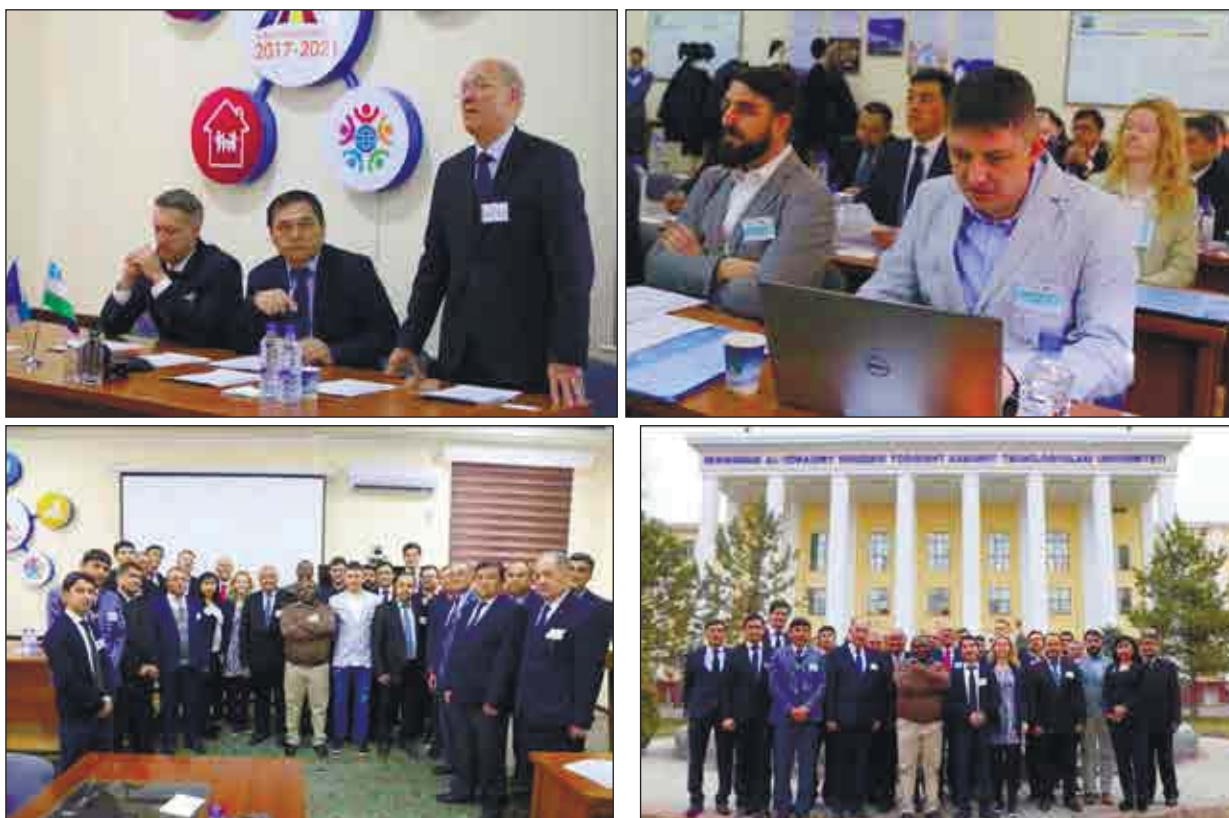
1-расм. Бошланғич семинар

Семинарларда лойиҳанинг ижроси муҳокама қилинди. Европалик мутахассислар бакалавр ва магистратуранинг ўқув дастурларини, силлабусларни ва университетларда амалга оширилаётган илмий лойиҳалар ва магистратура, ҳамда докторлик диссертациялари мавзулари ни ўрганиб чиқишди.